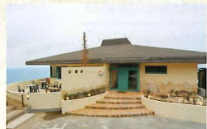
レストラン シーガル