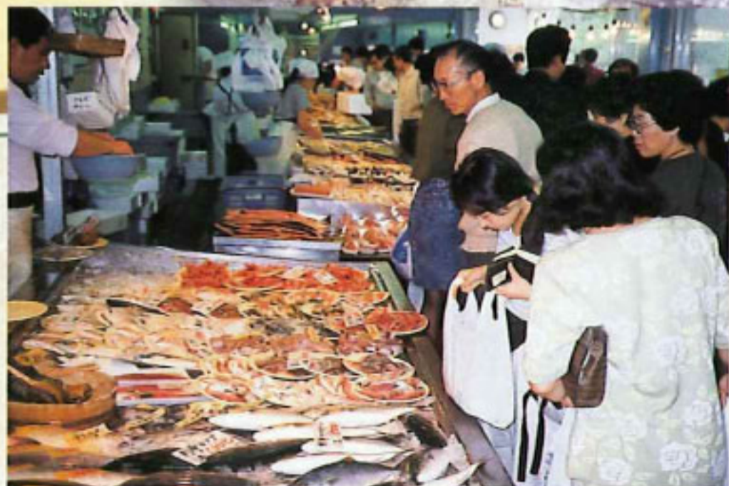
日本海鮮魚センター