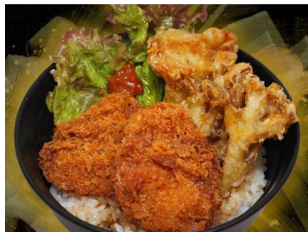
雪国まいたけとタレかつの越後うま辛丼

鮭ほぐし身に、ニンニク・ニンニクの芽・ラー油を合わせた食べるラー油進化版「ラー油鮭ン」(下画像真中)。ほっかほっかの白御飯にとっても合いそうですね。これなら優秀賞もナットクです。