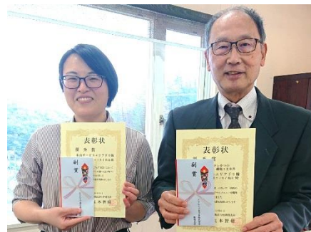
表彰状を掲げる東金社長と SA 店長