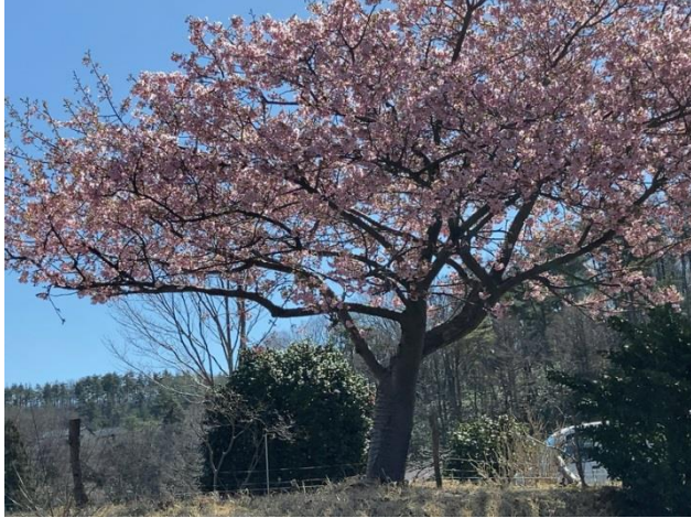
柏崎市：新赤坂（3月20日）

今冬の豪雪からうって変わり、3月は暖かすぎるほどの毎日でした。県内の桜は例年より2週間以上早い3月末には開花し、4月に入ると葉桜になっている木々も多い年でした。