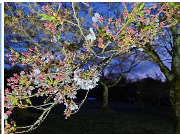
長岡市：悠久山公園夜桜 (4月12日)