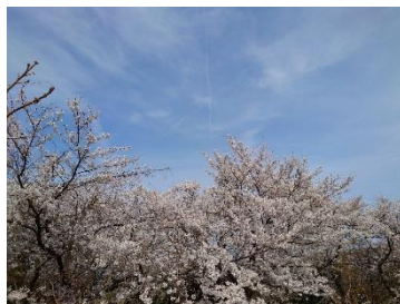
柏崎市：国民休養地跡 (4月4日)