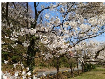
柏崎市：風の丘米山 (4月4日)