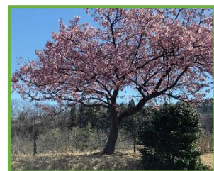
枝が折れてもつぼみをつけている桜や満開の桜もある