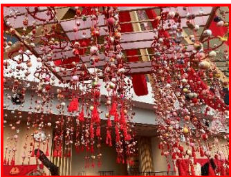
画像は「西山ふるさと公苑」つるし雛

（西山ふるさと公苑では3月26日まで展示中。史跡・飯塚邸では4月19日～5月15日まで展示中）