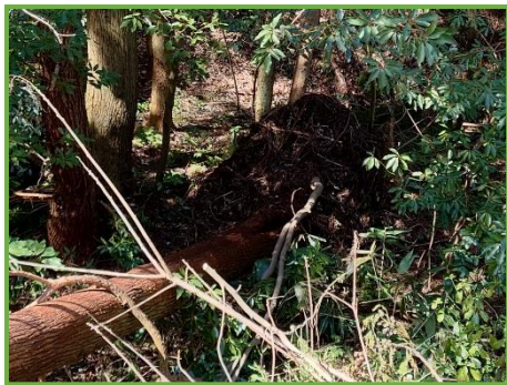
しっかりと張った根ごと倒れた樹木