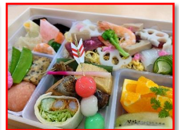
市内各所の雛飾り 写真右はキーウェスト福浦特製「ひなまつり弁当」