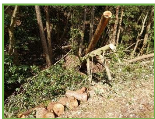
折れてしまって道路に掛かった為処理された木々

市内の桜も被害はありましたが、折れた枝の先につぼみをつけていたり、すでに満開の桜もありました。どんなに冬が厳しくても乗り越えて春がやってきますね。