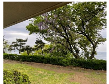
「良寛記念館」入口と、良寛さまの過ごした家