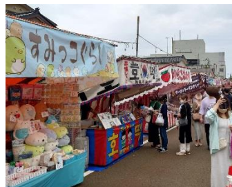
地元企業の出店エリアにはえんま市限定フード「スティック寿司」や柏崎名物グルメが多数販売されていました。