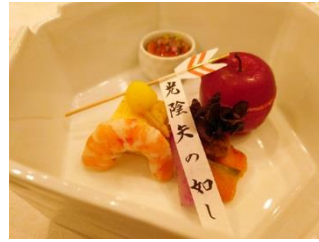
〔前菜：光陰矢の如し〕

寒波の予報が飛び交う12月17日、新潟市の『迎賓館 TOKIWA』様にて今年最後の料理堪能会が催されました。当日は予報に反して雪は少なく一安心。旬を迎えた「寒ぶり」が出され、趣向を凝らした煮物で期待を高め、その後の脂の乗った「真鱈のポワレ」で洋食の匠の味を愉ませて頂きました。酢の物の「金目鯛焼き霜」も脂が柑橘系ジュレでバランスの取れた味でした。前菜に添えられた「光陰矢の如し」は総料理長の心内の表れでしょうか。