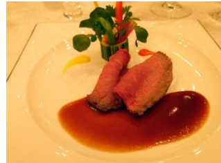
〔鹿兒島産黒毛和牛サーロインのロースト〕