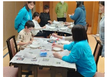
お披露目会の様子