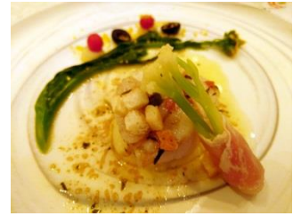
〔真鱈のポワレ グルノーブル風〕