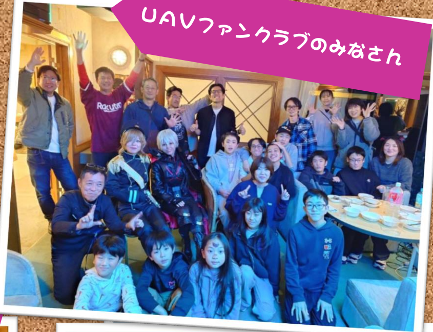
UAVファンクラブのみなさん