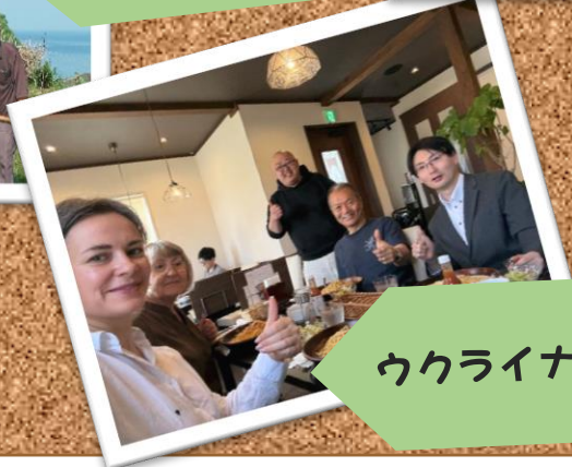
ウクライナ避難民とお食事