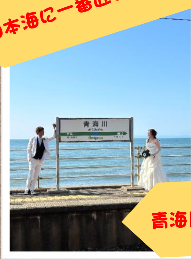
青海川駅でウェディングフォト