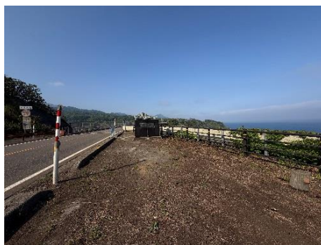
[雑草を刈り取り歩道が見えるように]