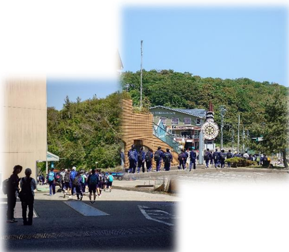
[休息を終え恋人岬へ向かう生徒さん達]

五月の中旬、「柏崎市立第三中学校」の三年と二学年の皆さんが、遠足のトイレの休憩でシーポートを訪れました。入館した生徒さん達は各々、3階と2階に別れましたがそれぞれの絶景スポットに大興奮。ロビーからの眺めや、2階レストラン外テラスの開放感にしばし疲れを忘れて楽しんでいました。初めて入館されたという生徒さんが多い中、「こんなに綺麗な所だとは思わなかった」という言葉も。今以上に、広く市民の皆さんにご利用頂ける様にしなければと感じる1日でした。